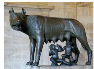
Die kapitolinische Wölfin

Im Zentrum des modernen Lateinunterrichts stehen Inhalte der römischen (und griechischen) Kultur, wie das Alltags- und Privatleben der Römer, ihre Religion, Mythologie und Geschichte, ihre Rechtsvorstellungen und Philosophie. Durch dieses Grundlagenwissen werden wir auch zu unseren eigenen Wurzeln und denen Europas geführt.