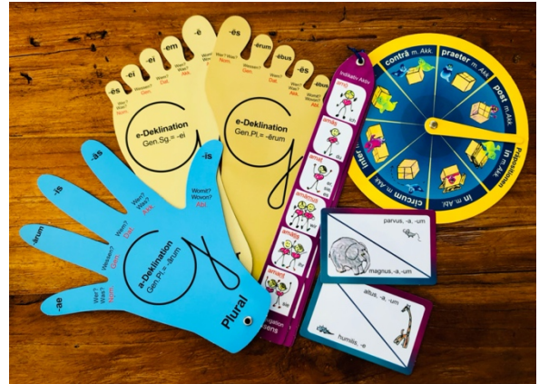
Aus: Latein mit Händen und Füßen. CC Buchner

leichten Sätzen zur Einführung der neuen Grammatik. Es gibt zahlreiche vom Verlag angebotene Zusatzmaterialien, die das individuelle Lernen den Bedürfnissen des Schülers/der Schülerin entsprechend unterstützen. Und auch der tägliche Unterricht zeichnet sich durch Abwechslungsreichtum und Kreativität aus. Innovative Methoden und Arbeitsweisen sowie moderne Medien, wie Computerprogramme, das Internet oder Film- und Hörbeiträge, haben im Lateinunterricht heute einen festen Platz.